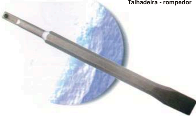
Talhadeira - rompedor