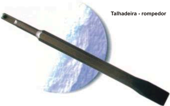
Talhadeira - rompedor