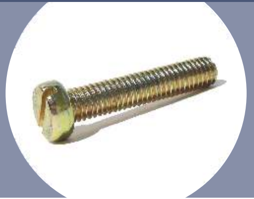
Tabela de Dimensões

Acabamento - Bicromatizado Dimensões - DIN 84 Rosca - DIN 13